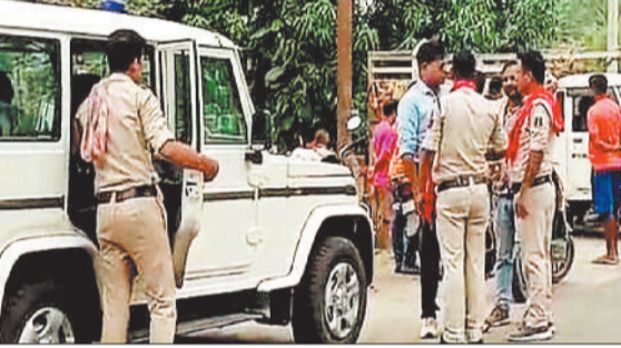
पूछताछ करती पुलिस की टीम।